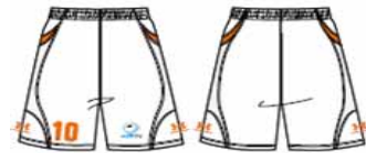
【2nd フィールドプレイヤー】