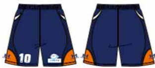
【1st フィールドプレイヤー】