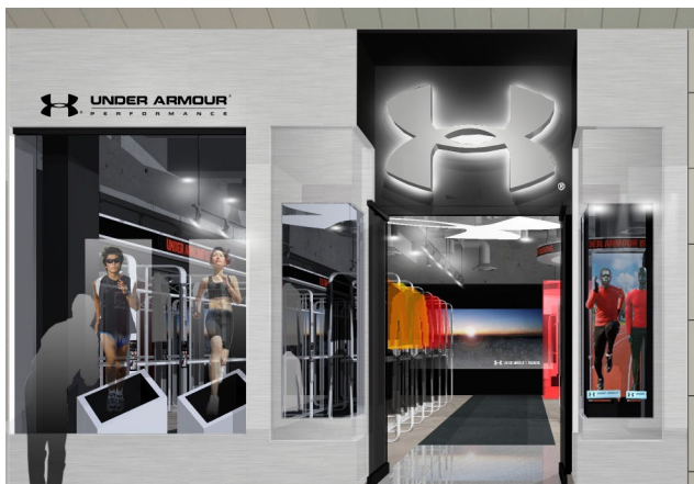
正面玄関イメージ