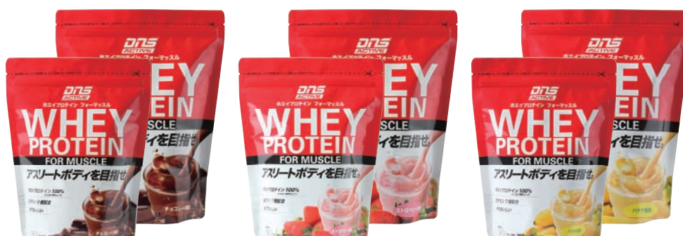
チョコレート風味

プロテインユーザーに馴染み深いチョコレート風味に加え、バナナ風味、ストロベリー風味をラインアップ。